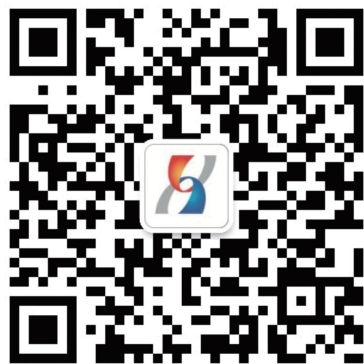
体博会微信公众号