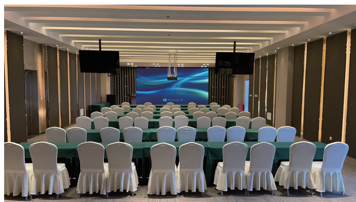
夹层 302 / 602