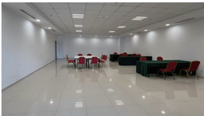
二层 B2-1 / B3-1