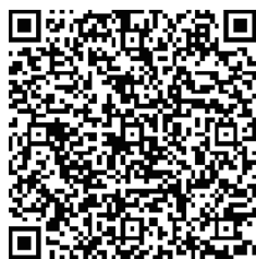
2023 中国体博会境内观众预登记二维码